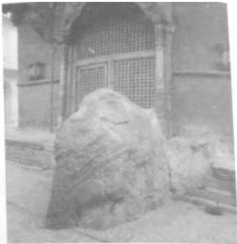
Fig. 6. Stone –god.