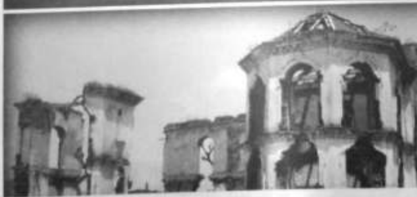
पुतली दरबार पहिले र अहिले