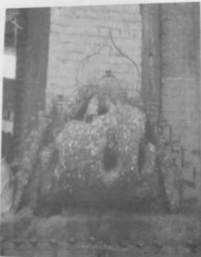
Fig. 3: The old wooden piece in the shape of a molar.