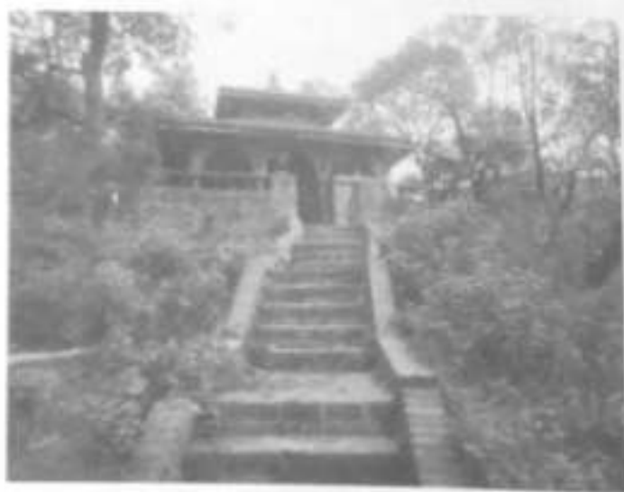
Fig. 7. Parvati temple, Surya Vinayak, Bhaktapur