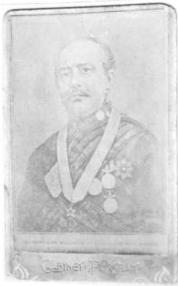
Fig. 6: Maharaja Shri Tin Rannudip Narashima