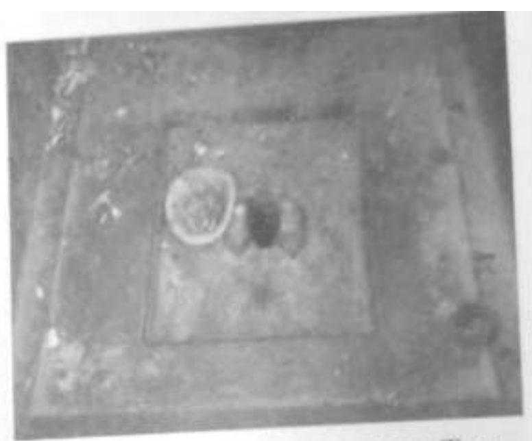
Fig. 2: The main prayer place: Two ear shaped stones with a hole in the middle.