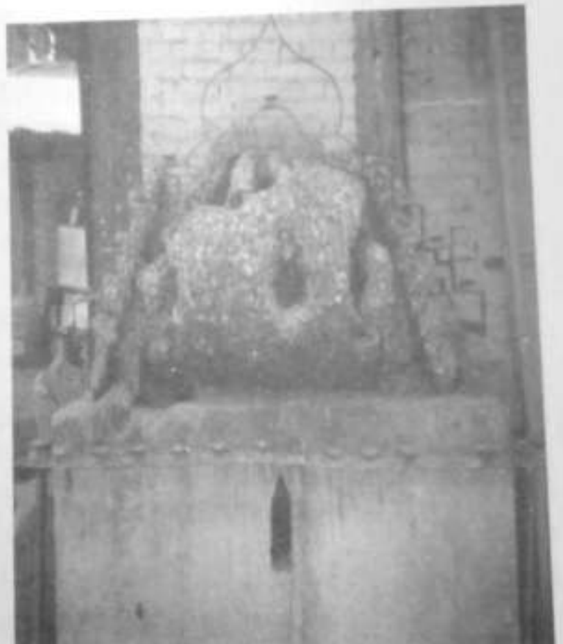
Fig.4: So many coins- difficult to find space to fix a coin. (photos taken in 2013)