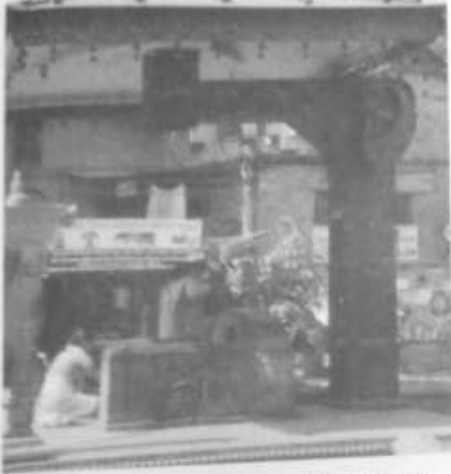
Fig. 1: A woman worshipping at Kaandeutathaan. (photo taken in 2013)