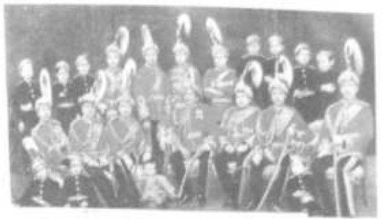
Fig. 3: The Seventeen Brothers of Kunwar Family