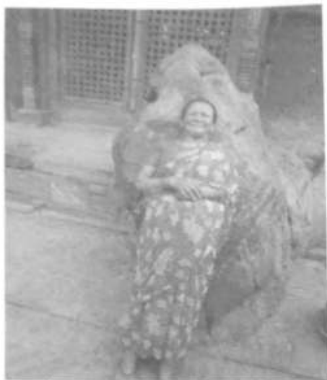
Fig. 5. A woman happy to lean on the healing- stone.