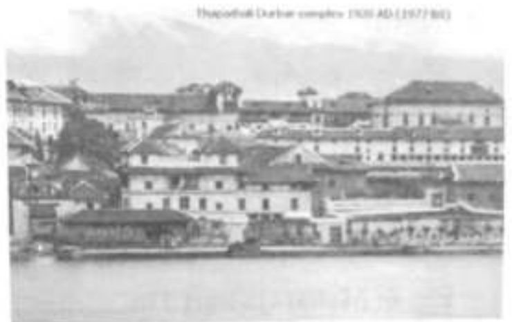
Fig. 4: The Thapathali Durbar in 1920 AD