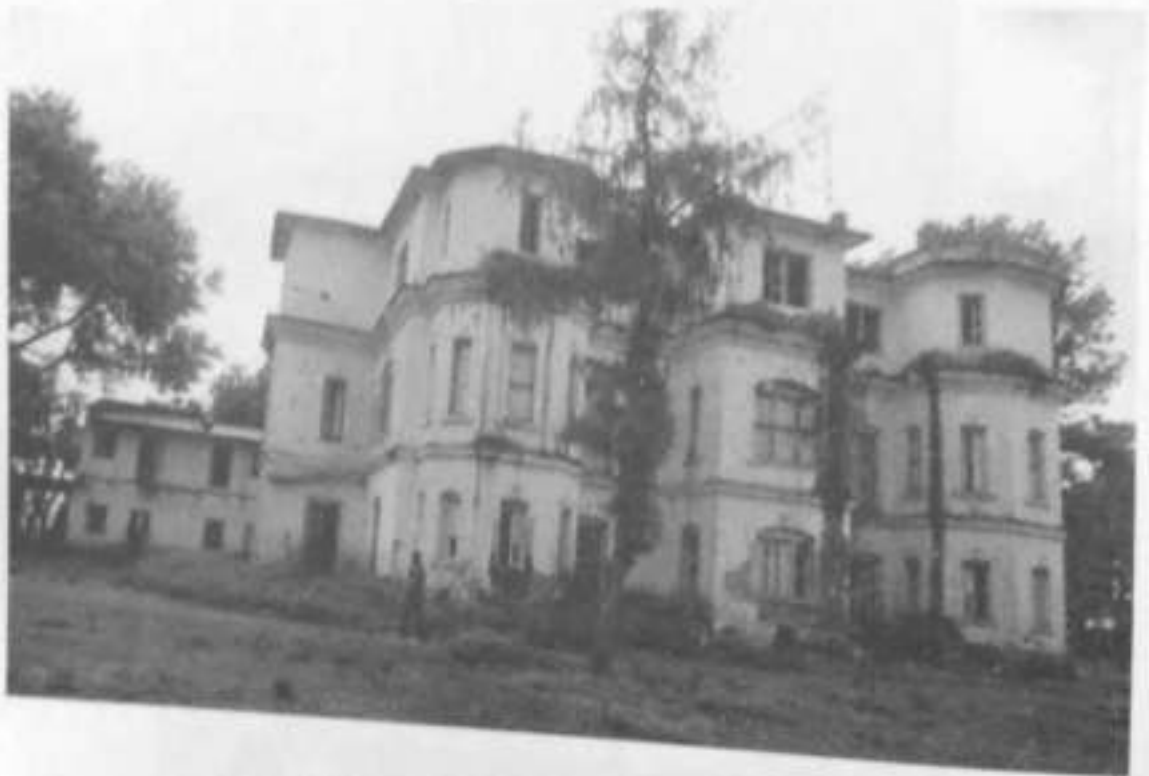
दाड तुलसीपुरस्थित सेतो दरबार