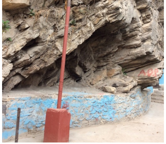
चित्र नं. ९ भगवती गुफा भित्र वाद्यवादन, सूर्यघाट परिसर चित्र नं. १० सानो ओडार, सूर्यघाट परिसर