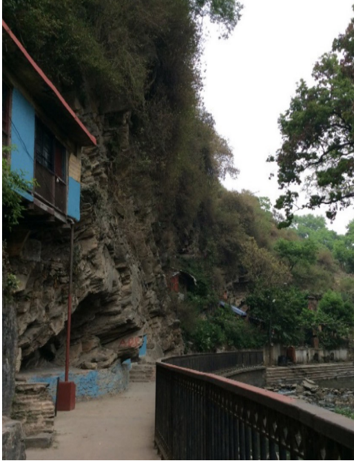
चित्र नं. १ गुफाहरू सहित सूर्यघाट परिसर