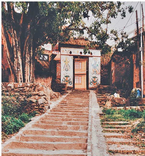
चित्र नम्बर २ : कीर्तिपुर सहरको किल्लाहरूमा रहेका मध्यकालिन ढोकाहरू मध्ये हालसम्म अस्तित्वमा रहेको देवढोका ।