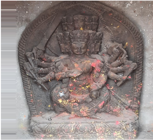
Mahakali of sub deval (southeast)