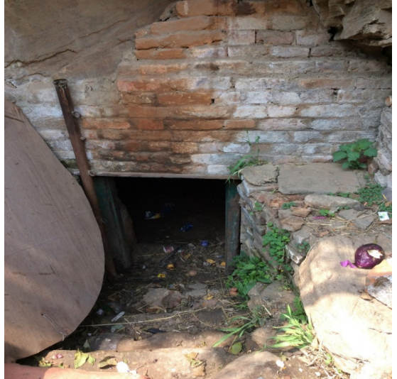
चित्र नं. ४ सिद्धगुफा, सूर्यघाट परिसर