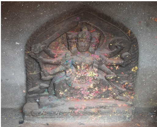
Mahaguari of sub deval (northwest)