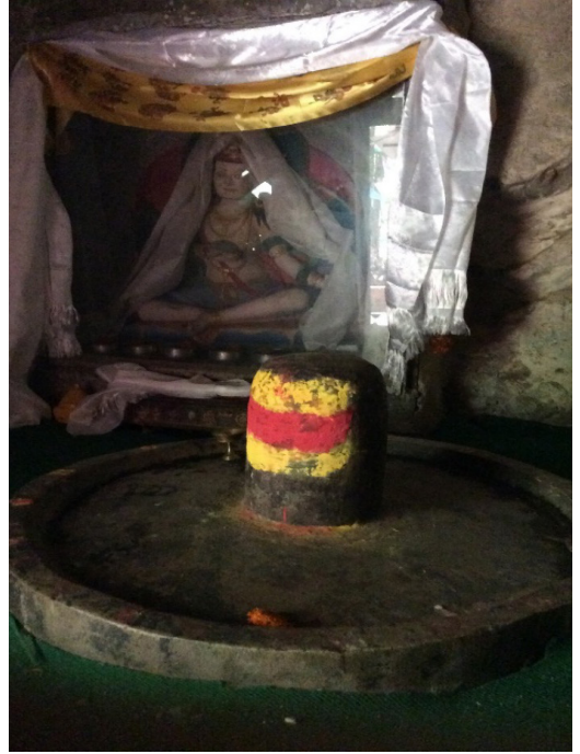
चित्र नं. ६ नारोपा मूर्ति र अखण्डवृत्ति, गुफा भित्र, सूर्यघाट परिसर