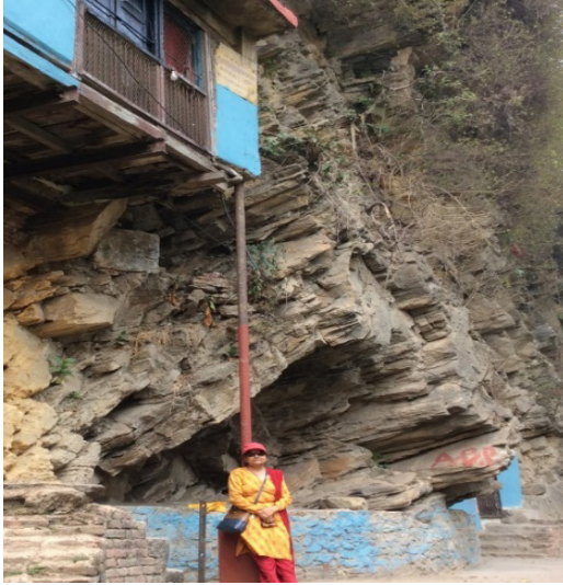
चित्र नं. ३ वासुकी गुफा र अनुसन्धानकर्ता, सूर्यघाट परिसर