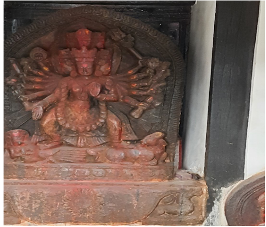
Harishankari (Parameshwori) main deval