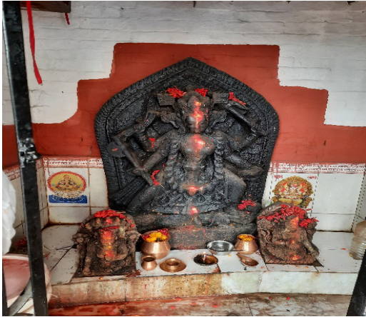
Durga (southeast of pond)