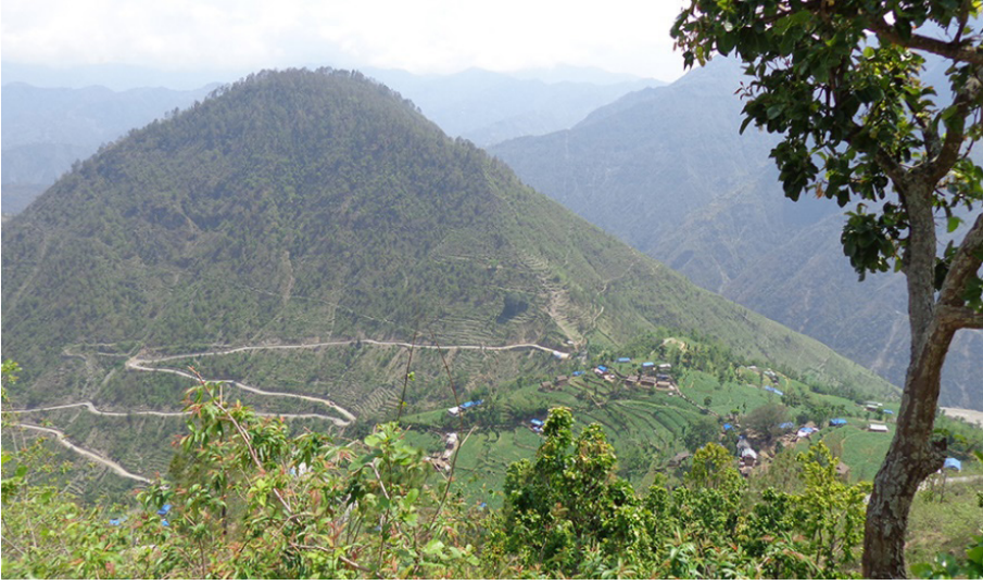
तस्विर १ : हिलेपानी गाउँको भलक ।