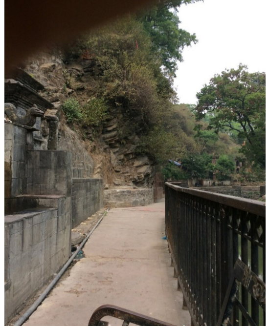
चित्र नं. २ गुफाहरू तर्फ जाने मार्ग, सूर्यघाट परिसर