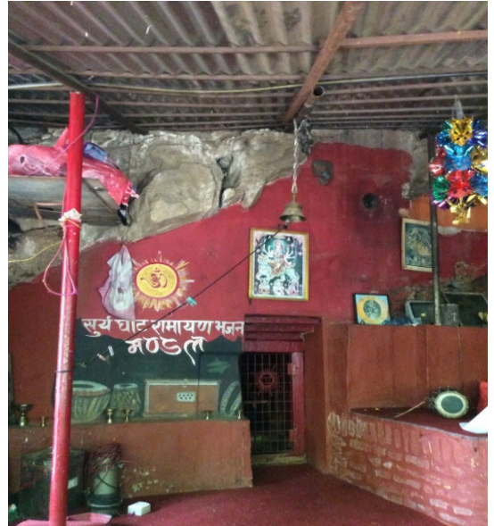
चित्र नं. ८ भगवती गुफा, सूर्यघाट परिसर