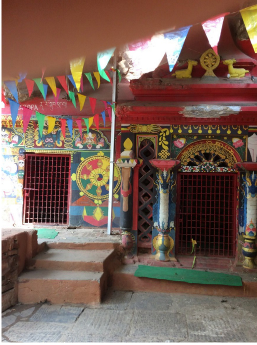
चित्र नं. ५ नारोपा (दायाँ) र तिलोपा (बायाँ) गुफा, सूर्यघाट परिसर