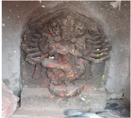
Nataraj of sub deval (southwest)