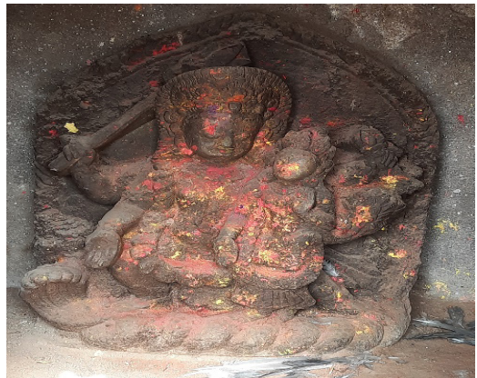
Bhairavbhairavi of sub deval (northeast)