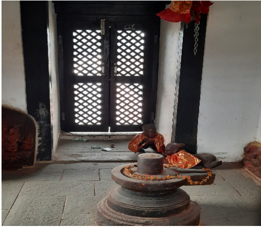
Shivalinga (Parameshwor) main deval