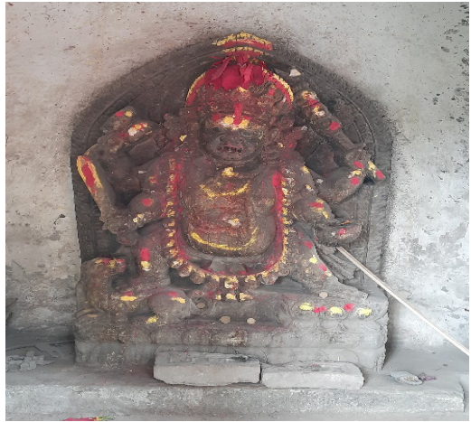
Vatuk Bhairav (Northeast of pond).