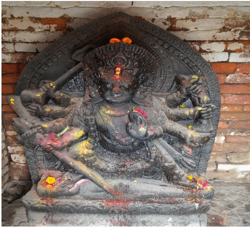
Bhairav (northwest of pond)