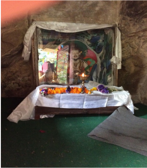
चित्र नं. ७ तिलोपा मूर्ति र शिवलिङ्ग, गुफा भित्र, सूर्यघाट परिसर