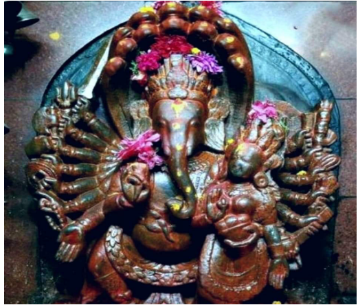
Ganesh with Shakti (southwest of pond)