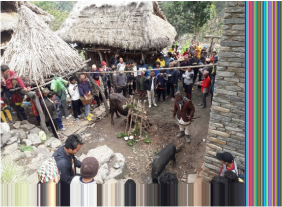
तस्बिर २ : खाउमामा सुम्दी-सिली नाचदै।

दोस्रो दिन - दोस्रो दिनलाई 'सामा दिन' भनिन्छ। दाजु-भाइ, नाताकुटुम्ब, मोही आदि सम्बन्धित सबै भेला हुने काम हुन्छ। दाजुभाइले सघौं/अलोपालो सहयोग (जाँड, चामल/सामल र नगद सहयोग) लिई भेला हुन्छन्। यो परस्परमा चलिरहने रीत हो। खाउमा गर्दा वंशीय दाजु-भाइबीच मात्र नभइ कुटुम्बबीच समेत जिम्मेवारीको बाँडफाँड गरिएको हुन्छ। कसैले चौतारो बनाउने, कसैले सुरिम र खासी सिड (काठ) ल्याउने, कसैले मुढा ल्याउने, कसैले पात ल्याउने, कसैले आँगनमा सुरिम र खासीहरू गाड्ने। कसैले त्यसमा राँगा, सुँगुर, कुखुरा बाँध्ने, कसैले पूजाका अन्य सामग्रीहरू जुटाउने आदि कामहरू गरिन्छ। यी तयारी सकिएपछि नाक्सो, डाबुचो र सुरिमचोले घरभित्र 'सोचाम' (पितृ बुझाउन मुन्धुम फलाक्ने काम) प्रारंभ हुन्छ। यस क्रममा घरभित्रबाट आँगनमा सुरिमचो-नाक्सो (सुरिम पूजारी) आई "थेबिदे...थेबिदै..." भन्दै पूजा गर्छन्। यसपछि बलिको लागि बाँधिएका राँगा, सुँगुर र कुखुरालाई सबै नाक्सोहरूले जाँड, चामल, कालो मास आदिले छर्किन्छन्। मृतात्मालाई नभङ्किइकन पितृमा समावेश हुनलाई सम्झाइदै मुन्धुम फलाक्न थालिन्छ। मृतात्माको खुसीको लागि आँगनमा सुरिमको वरिपरि सुम्दी/भ्याम्टा बजाउँदै नाचन थालिन्छ। भ्याम्टा 'भ्वायुम मोयुम.... भ्वाम भ्वाम ....' बजाउँदै नृत्यको अगुवाइ गर्ने 'सिलिचो' र 'मासिमे' को पछिपछि मुख्यगरी दानीतर्फका सहभागीहरू नाचन थाल्दछन्।