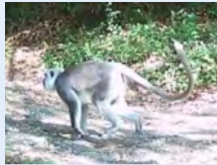
नेपाली लंगूर ( Semnopithecus schistaceus )