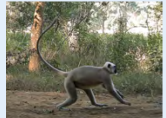
तराई लंगूर ( Semnopithecus hector )