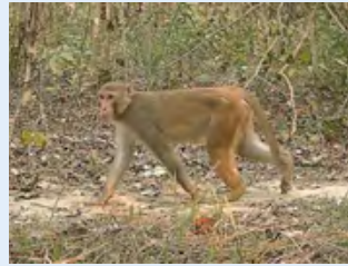
रातो बाँदर ( Macaca mulatta )

नेपालमा चार प्रजातिका बाँदरहरू पाइन्छन्- पहेरे (आसामी) बाँदर, नेपाली लंगूर, तराई लंगूर र रातो बाँदर । पहेरे र लंगूर प्रजातिका बाँदरहरू प्रायजसो वन क्षेत्रमा सीमित हुन्छन् । यिनीहरूले नेपालको केही स्थानहरू बाहेक मानिसहरूलाई दुःख दिएको वा बालीनालीमा क्षति गरेको देखिँदैन । तर मानव-बाँदर द्वन्द्वको प्रमुख कारकका रूपमा रातो बाँदर देखिएको छ । रातो बाँदर छोटो समयमै नयाँ वासस्थानमा अनुकूलन गर्न सक्ने क्षमता भएका तथा अवसरवादी स्वभावका हुन्छन् । यिनीहरू साधारणतया खेतवारी वरपरीको वनजंगलमा बस्न रुचाउँछन् । यिनीहरूले खेतवारी, घरआँगन तथा सार्वजनिकस्थलहरूमा सजिलै खानेकुराहरू पाउने भएकाले यिनीहरूबाट द्वन्द्व सिर्जना भएको देखिन्छ । साथै मानिसहरूले विभिन्न बाहानामा यिनीहरूलाई खानेकुरा खुवाउने गर्नाले यिनीहरूको आनीवानी परिवर्तन हुनु र यिनीहरूको प्राकृतिक शिकारी जनावरको संख्यामा पनि कमी भएकाले रातो बाँदरको संख्यामा अत्याधिक वृद्धि भई मानिस र बाँदर बीच द्वन्द्व बढेको छ ।