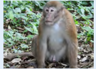
पहेरे बाँदर ( Macaca assamensis )