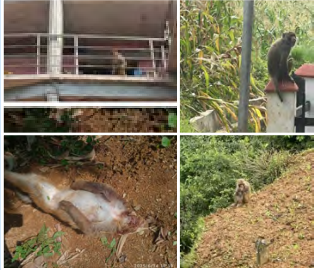
मानव-बाँदर द्वन्द्व भल्काउने तस्वीरहरू

मानव-बाँदर द्वन्द्व व्यवस्थापनमा हाल प्रयोग भइरहेका बाँदर धपाउने, स्थानान्तरण गर्ने र क्षतिपूर्ति दिने जस्ता उपायहरू प्रभावहीन देखिएका छन् । साथै अनुमति बिना बाँदर मार्न प्रयोग भएका विद्युतीय धराप, प्रविधिक दक्षता बिना समाउने वा क्रुर तरिकाले मार्ने अभ्यासले मानव जीवनमा समेत गम्भीर जोखिम बढाइरहेको छ । क्षतिपूर्ति संयन्त्रले कृषकहरूलाई केही राहत उपलब्ध गराएता पनि यसको लागत वितरणमा असमानता र दीर्घकालीन दिगोपनसँग आर्थिक चुनौतीहरू कायमै छन् । रातो बाँदर बन्ध्याकरण कार्यक्रम आर्थिक स्रोतको व्यवस्थापन, न्यायोचित तथा कानुनी प्रक्रिया र कार्यान्वयनका हिसाबले जटिल भएता पनि केही द्वन्द्वग्रस्त क्षेत्रहरूमा परीक्षणको रूपमा गर्न सकिन्छ । अन्य देश जस्तै भारत, हङकङमा गरिएका यी उपायहरू द्वन्द्व न्यूनीकरण गर्न अपर्याप्त देखिएकाले रातो बाँदरको संख्या तत्काल नियन्त्रण गर्नुको विकल्प छैन ।