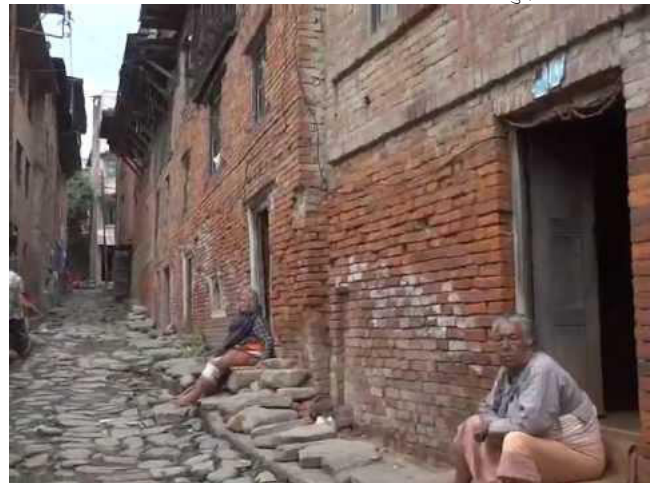
तस्बिर नं. ५ : पुरानो ढुङ्गा ओछ्याइएको बाटो