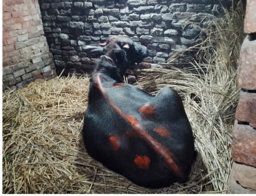
चित्र नं. १: बैद्यको घरको छिडिमा रहेको निकुथु