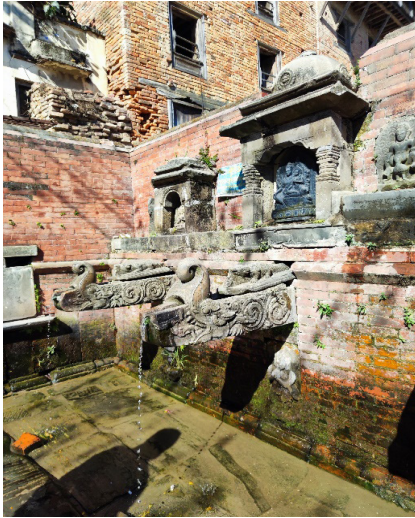
तस्बिर नं. ३ : नाला भगवती परिसरको ढुङ्गेधाराहरू