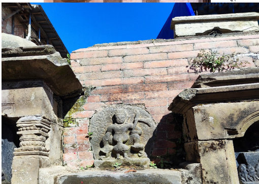
तस्वि नं. १६ : कुमारको मूर्ति र नालाको लिच्छविकालिन अभिलेख