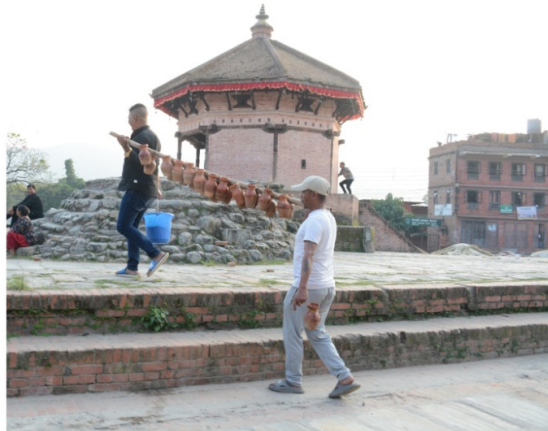
चित्र नं. ६: भेलुखेलमा प्रत्येकको घरमा कालरात्रिमा बलि लिइएका राँगाहरुको रगत छाप लगाएर फर्कदै