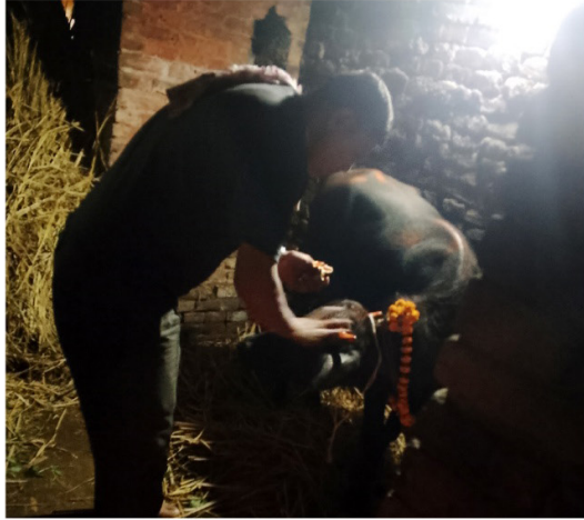
चित्र नं. २: कर्मचार्यद्वारा निकुथुको पूजा गरिदै