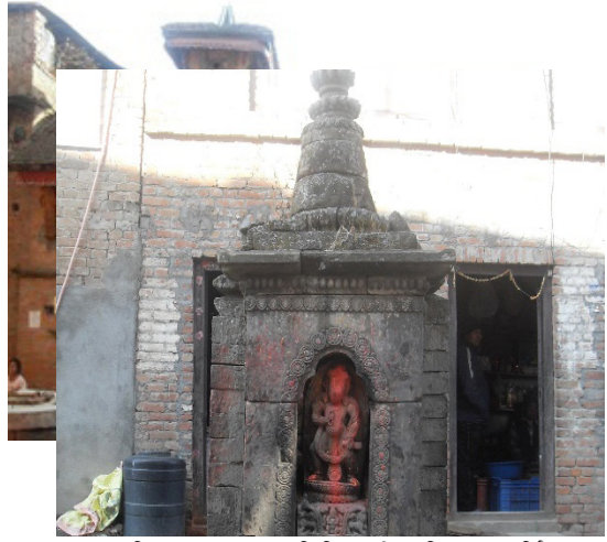
तस्विर नं. १३ : युधिस्थिरको मन्दिर र मूर्ति