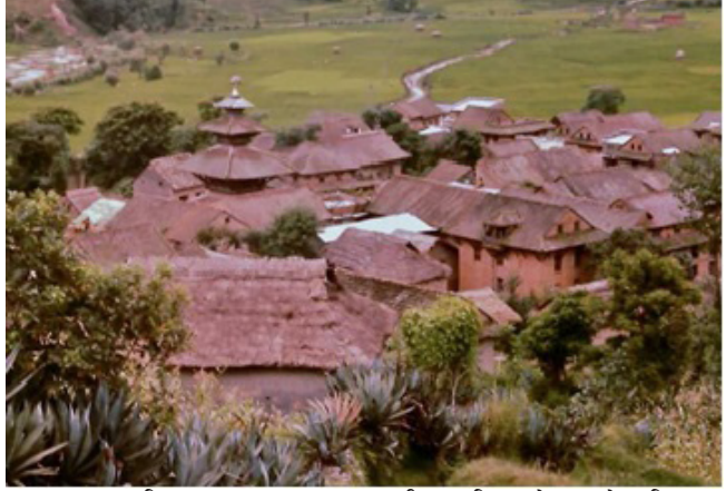
तस्बिर नं. २ : नाला भगवती र परिसरको पुरानो तस्बिर