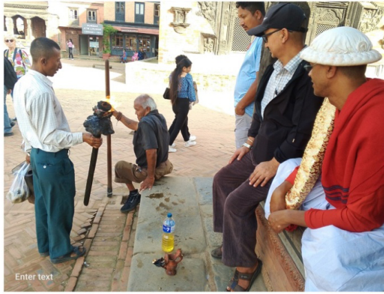
चित्र नं. ४: निकुथुको स्वागत गर्न बसेका राजोपाध्याय