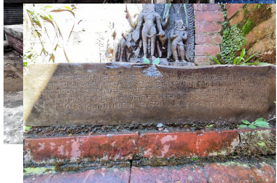
तस्विर नं. १७ : सूर्यको मूर्ति र त्यसको पादपीठमा उत्कर्ष शिलालेख