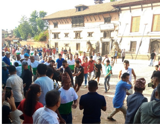
चित्र नं. ५: दरबार स्वयायरको परिसरमा निकुथुलाई घुमाउँदै स्थानीयहरू