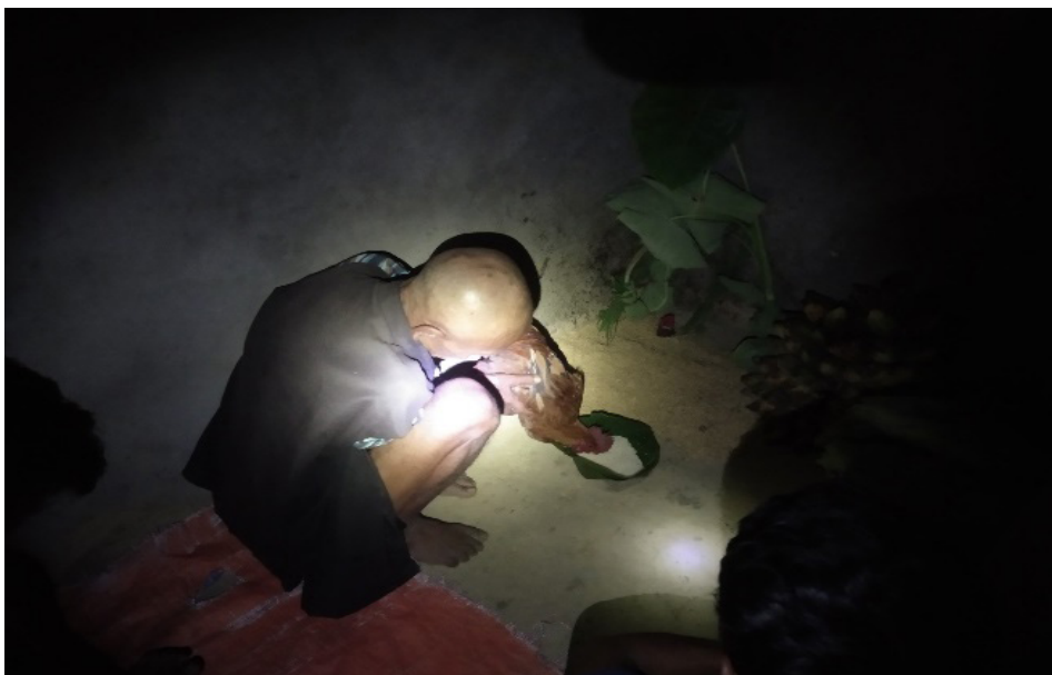
चित्र नं. ३ : छोनाम (न्वाँगी) पर्वको विशेष संस्कार : परिवारको संरक्षकको प्रतीक स्वरूप पालिएको कुखुराको भालेलाई कूलथानमा बलि चढाउनु अघि घैयाधान र चामल खान दिदै कूलपरिवारका जेष्ठ सदस्य