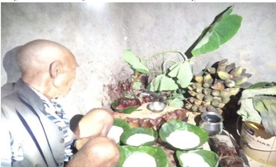
चित्र नं. ४ : छोनाम (न्वाँगी) पर्वमा कूलथानमा र नयाँ खाद्यवालि, भातीजाँड र कूलको भाले बलि चढाउँदै कूलपरिवारको जेष्ठ सदस्य