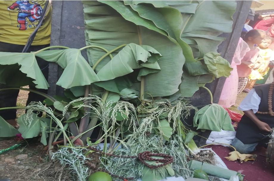
चित्र नं. २ : छोनाम (न्वाँगी) पर्वमा प्रतीक स्वरूप चढाइएका सामग्रीहरू: घैयाधान, भेटीचामल, गाभापिँडालु, केराको बोट तथा पात, निबुवा, बुकीफूल, बोधिचित्तमाला साथमा नवपान्दे