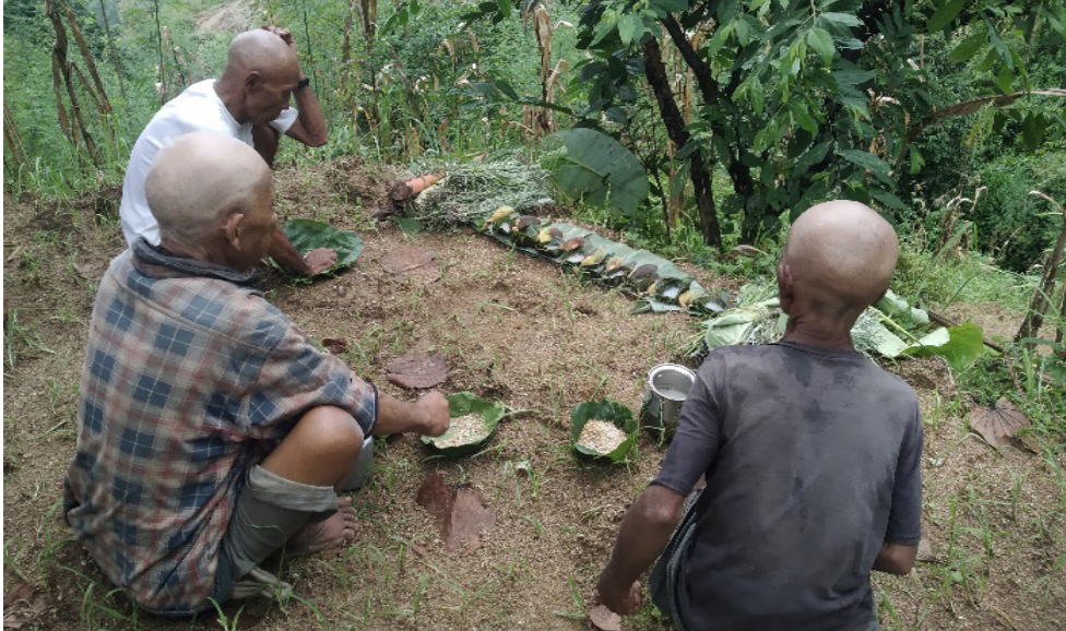
चित्र नं. ६ : छोनाम (न्वाँगी) पर्वमा प्रतीक स्वरूप चढाइएका सामाग्रीहरू: पित्र (मृतात्मा) लाई तान्त्रिक विधा गरी सामुहिक भोज गराउँदै कूलपरिवारको जेष्ठ सदस्य र पान्देहरू