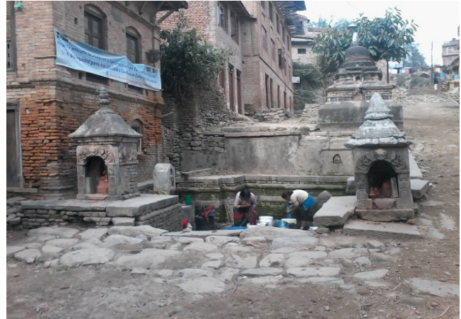
तस्बिर नं. ४ : नाला नगर भित्र दोबाटोको ढुङ्गेधारा