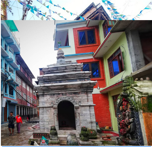
तस्विर नं. १२ : नाला नगरको महादेव मन्दिर नालाका केही प्रचलित मूर्ति र प्राचीन अभिलेखहरू