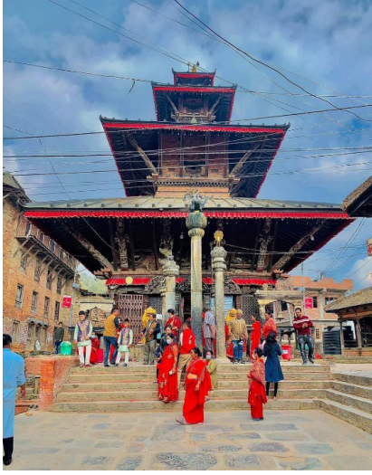
तस्बिर नं. १ : नाला उग्रचण्डी भगवतीको मन्दिर