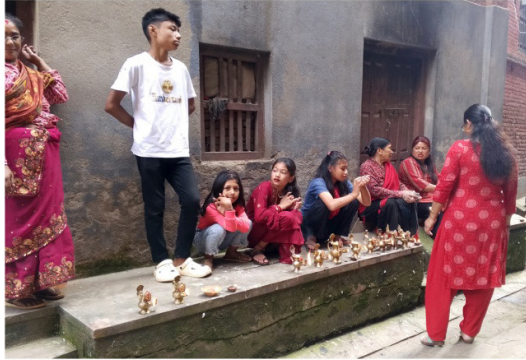
चित्र नं. ३: ब्यासी टोलमा सुकुण्डा लिएर बसेका स्थानीयहरु