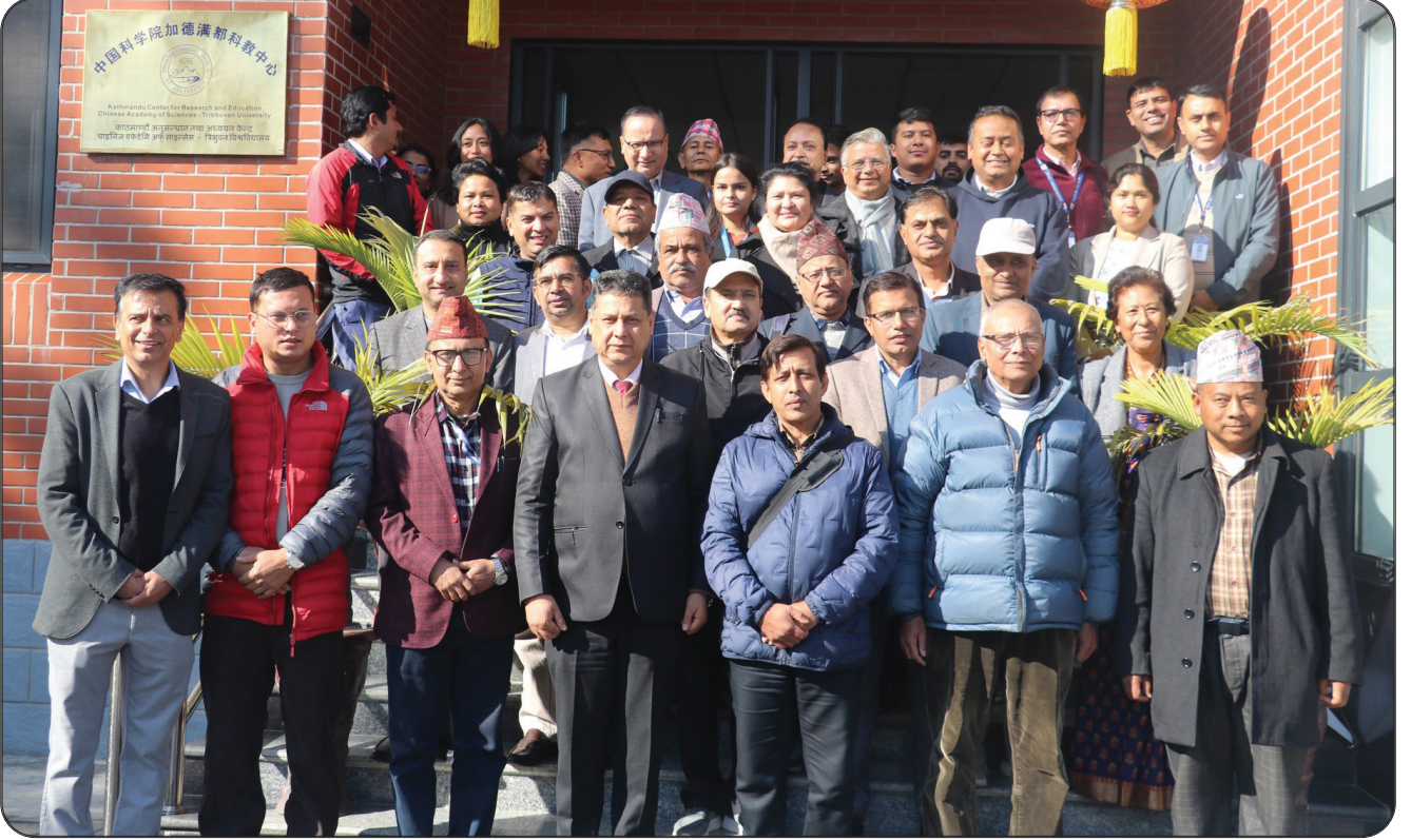
त्रिवि जल तथा मौसम विज्ञान केन्द्रीय विभागले आयोजना गरेको वन डढेलोसम्बन्धी अनुसन्धानका उपलब्धि आदान-प्रदान कार्यक्रममा त्रिविका उपकुलपति लगायत अन्य सहभागीहरू ।

लेखहरू प्रकाशित गरिएको, स्नातकोत्तर तहमा अध्ययनरत तीनजना विद्यार्थीको शोधवृत्ति अनुसन्धानका लागि आर्थिक सहयोग उपलब्ध गराएको साथै समाजमा वन डढेलोबारे जानकारी गराई यसले समग्र जैविक विविधतामा