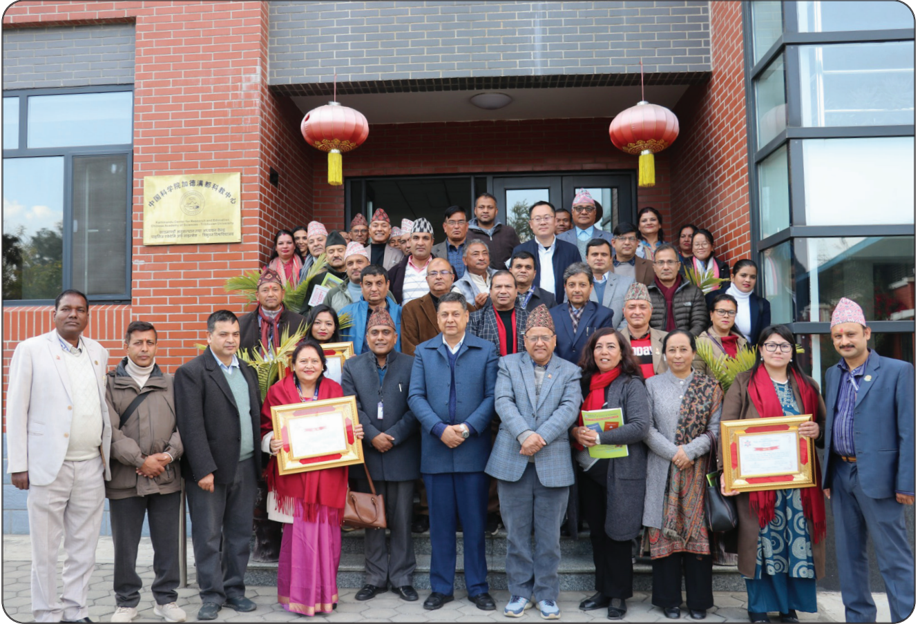
विज्ञान तथा प्रविधि अध्ययन संस्थानको ५३ औं वार्षिक दिवस कार्यक्रममा सहभागी त्रिविका उपकुलपति, डीन एवम् अन्य सहभागीहरू ।