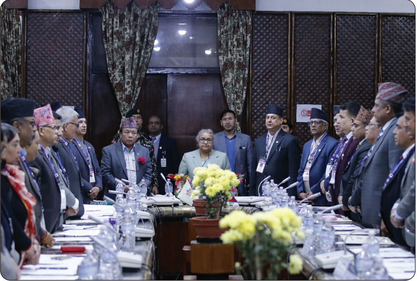
त्रिवि सभाको बैठकमा सहभागी विश्वविद्यालयका कुलपति, उपकुलपति, सहकुलपति एवम् पदाधिकारी तथा सभासदहरू ।